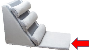
(Şekil-2: Oturma parçasının açılmış görüntüsü.)

Belpad'ı yerde kullanırken minder gövdenin alt kısma sabitlenebilen ayrılmaz oturma parçasını aşağıda gösterildiği şekilde açmayı unutmayınız: